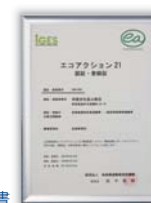
環境省策定「エコアクション21」認証書

平成19年4月、環境省が策定した「エコアクション21」認証を取得。環境に配慮した経営を行う会社として、お客様に排出物の抑制指導やリサイクルを積極的にご提案しています。